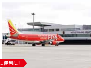
離発着時には富士山や南アルプスの絶景を眺めることのできる空港です。北海道からも、九州からも約90分でアクセスできます。