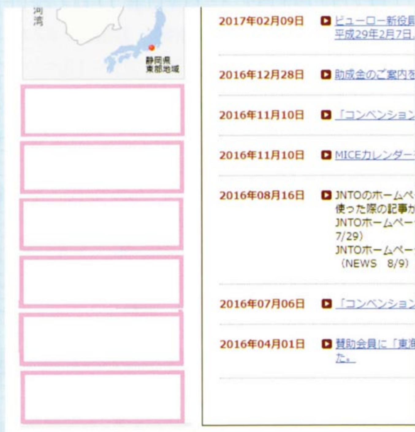
レイアウト (イメージ)