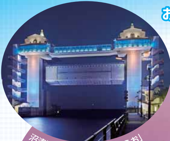
沼津港大型展望水門「びゅうお」

富士の絶景、伊豆の名湯、新鮮な海の幸がもてなす 癒しの空間、静岡県東部で、会議・大会など コンベンションの開催を お待ちしております